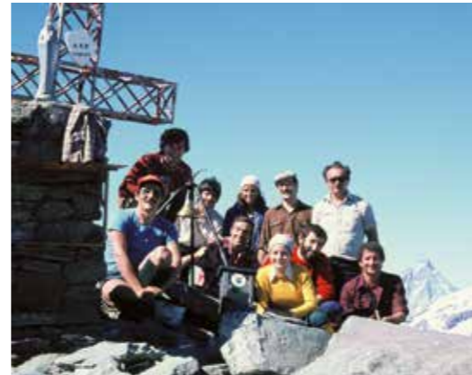
Settembre 1978 - la posa della Campana

Furono prese in esame diverse vette, "troppo difficile, troppo facile, non c'è panorama, ...", finché infine fu scelta la Testa Grigia, una delle vette più panoramiche delle Alpi: montagna solitaria e rocciosa, da dove è possibile con lo sguardo abbracciare tutte le montagne della Val D'Aosta, e spingersi fino alla piramide isolata del Monviso e ai ghiacciai delle Alpi centrali.