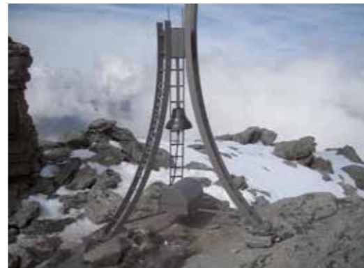
2018 - la Campana oggi

Tratto dal libro: RICORDI - 80 anni di Montagna a Parabiago